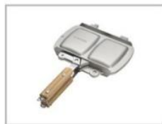
ホットサンドクッカー