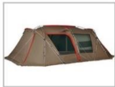
オールインワンテント ※アップライトポール含む