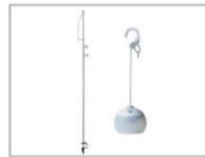
LEDランタンセット (1台、3個)