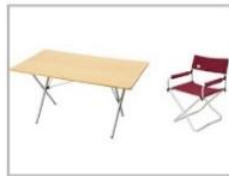
テーブル&チェア (1台、5脚)