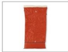
シュラフ (5 袋)